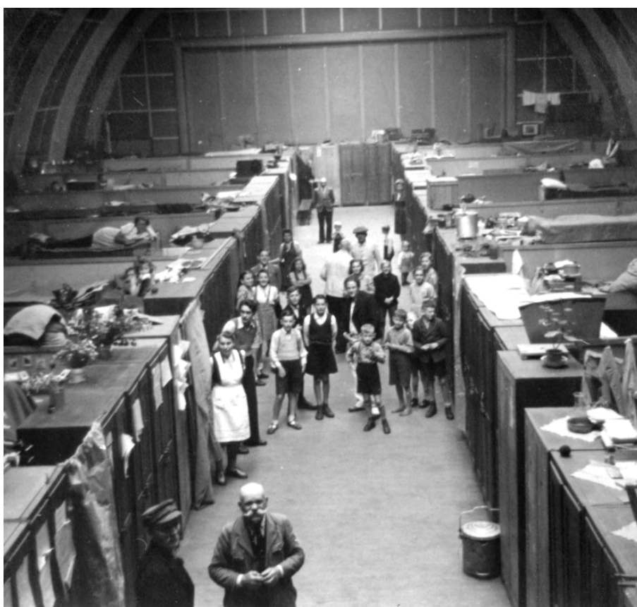
Flygtninge i OD-hallen, Ollerup Gymnastikhøjskole 1946.

I de sidste måneder af krigen kom der ca. 245.000 civile flygtninge til