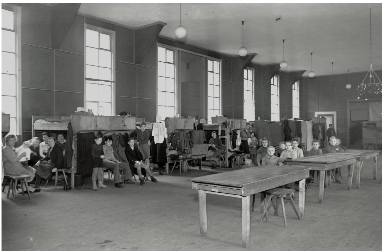
Flygtningefamilier indkvarteret i foredragssalen på Luthersk Missionsforenings Højskole 1945